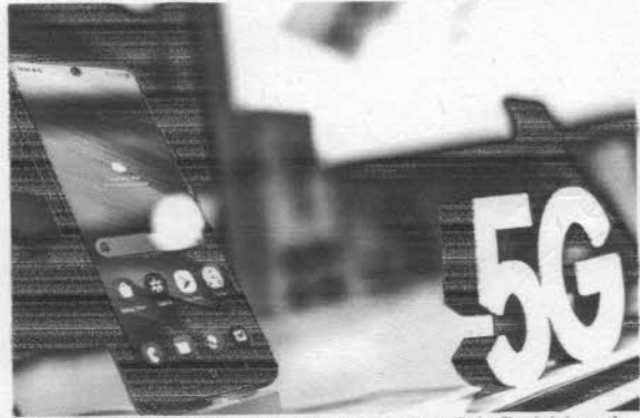
Faixa de acelerar a conectividade, o projeto traz benefícios diretos às famílias de baixa renda

O Brasil dá um passo significativo na modernização de sua infraestrutura tecnológica. Isso porque todos os 5.570 municípios do país estão agora aptos a receber a ativação do 5G standalone, também conhecido como 5G "puro", graças à conclusão da limpeza da faixa de 3,5 GHz. Esse avanço, liderado pela Agência Nacional de Telecomunicações (Anatel) e pela Entidade Administradora da Faixa (EAF), marca um marco histórico na expansão da conectividade nacional. O 5G puro promete revolucionar a conectividade, oferecendo uma velocidade média de 1 Gbps, até dez vezes superior ao 4G, com potencial de alcançar até 20 Gbps. Atualmente, a rede já registra velocidades médias de 300 Mbps, muito acima do padrão anterior, mas ainda distante do pleno potencial da tecnologia. Embora a ativação da faixa permita a implementação do 5G em todo o território nacional, a expansão efetiva da cobertura depende do planejamento das operadoras Claro, TIM e Vivo, que têm até 2029 para atender todos os municípios com mais de 30 mil habitantes. Desde a chegada do 5G em Brasília, em julho de 2022, a tecnologia já alcançou 770 municípios, beneficiando cerca de 15 milhões de brasileiros. Além de acelerar a conectividade, o projeto traz benefícios