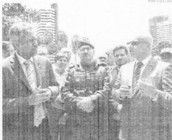
O acordo firmado na reunião contou com assinaturas dos representantes dos poderes