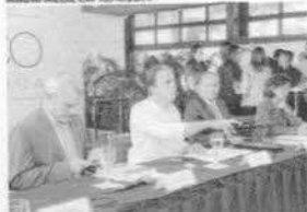
8ª reunião do Comitê de Governança do Pacto por um Ceará Pacífico, no Palácio da Abolição, em 2019